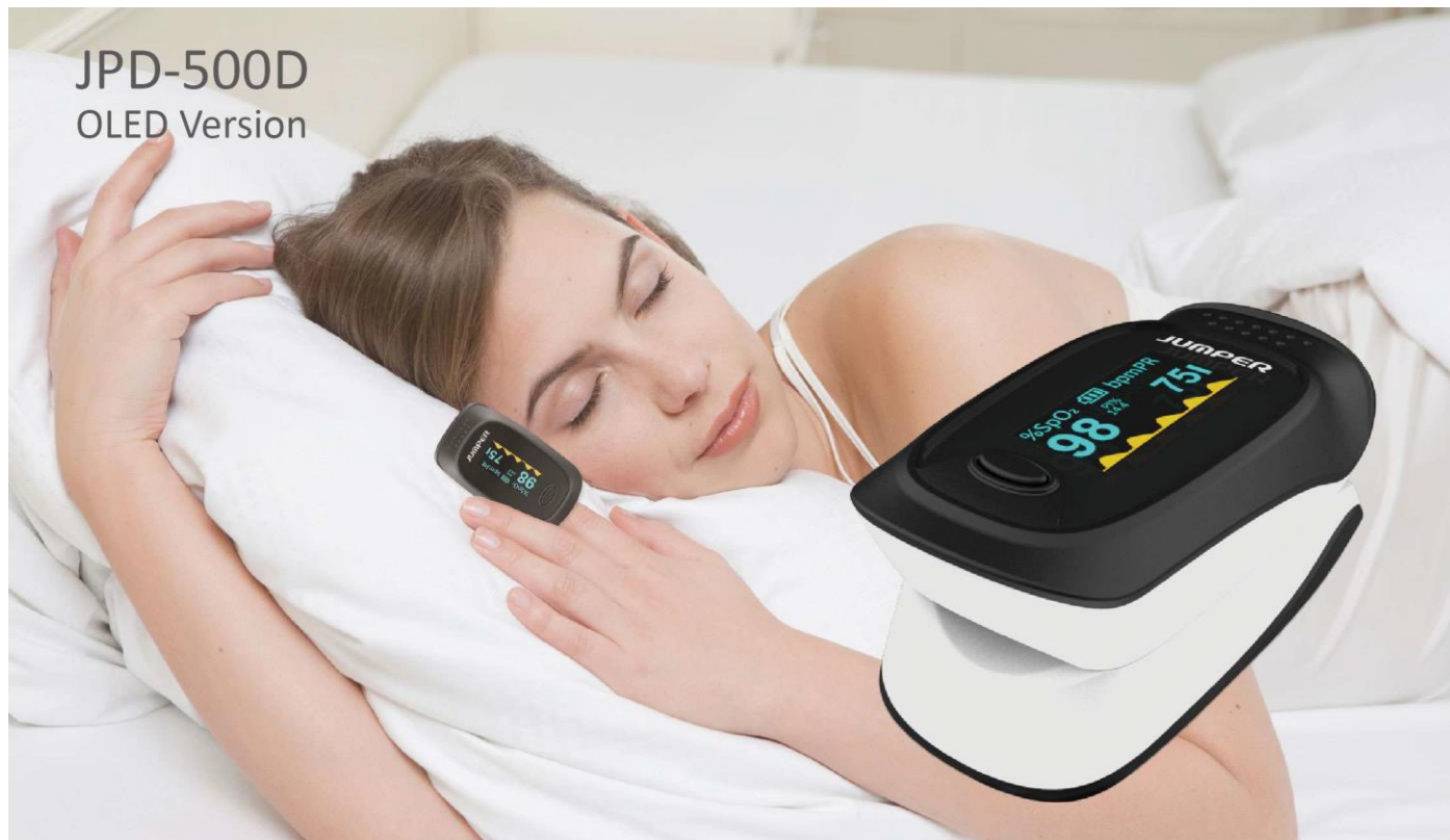
JPD-500D OLED Version

Pulsoksymetr napalcowy 500D (OLED) jest przeznaczony do pomiaru ilości natlenionej hemoglobiny we krwi w zadanym czasie. W urządzeniu została zastosowana fotoelektryczna technologia kontroli oksyhemoglobiny zgodna z technologią skanowania i zapisu wielkości impulsu, którą można stosować do pomiaru wysycenia tlenem hemoglobiny oraz tętna u ludzi poprzez palec. Urządzenie można stosować jako element codziennej opieki w domu, szpitalu, barach tlenowych, ośrodkach zdrowia, w opiece fizycznej w sporcie, itp. Produkt może być stosowany przed lub po aktywności fizycznej.